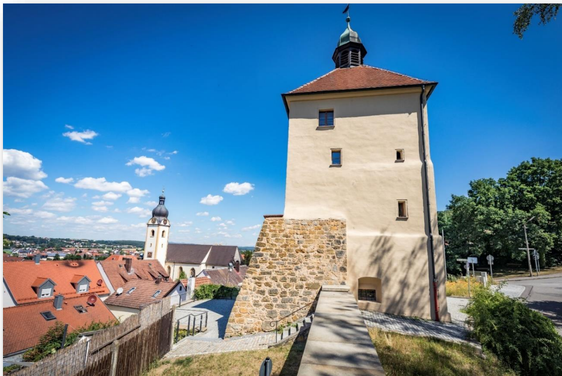
Thomas Kujat © Stadt Schwandorf